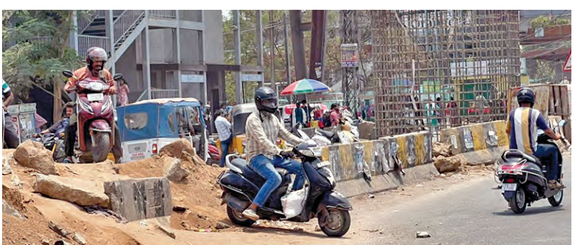
ఉప్పల్ చౌరస్తాలో డివైడర్ ఎక్కి ప్రయాణిస్తున్న వాహనదారులు దృశ్యం.

ఉప్పల్, మే 18 ప్రభాతవార్త : ఉప్పల్ చౌరస్తాలో కారిడార్ నిర్మాణం కారణంగా ట్రాఫిక్ దారిమళ్లించు చేపట్టడంతో వాహనదారులు తీవ్ర ఇబ్బందులు పడుతున్నారు. పరంగల్ జాతీయ రహదారిలో నిర్మిస్తున్న కారిడార్ పిల్లర్ నిర్మాణం కారణంగా మున్సిపల్ అధికారులు ట్రాఫిక్ దారి మళ్లించారు. అయితే దూర ప్రాంత ప్రయాణీకులకు దీనిపై అవగాహన లేకపోవడంతో ఉప్పల్ వరకు వచ్చిన తర్వాత చిక్కెల్లో వదులుతున్నారు. పలు చోట్ల బాధితులు ఏర్పాటు చేసినా వీటిని పట్టించుకోకుండా వాహనదారులు ప్రయాణాలు సాగిస్తున్నారు. దీంతో ఉప్పల్ వద్ద ట్రాఫిక్ రద్దీ నెలకొంటుంది. ముఖ్యంగా ఉదయం, సాయంత్రం వేళల్లో వాహనాల రద్దీ అధికంగా ఉండడంతో స్థానికులు తీవ్ర ఇబ్బందులు పడుతున్నారు.